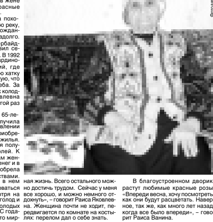
В благоустроенном домике растут любимые красные розы...