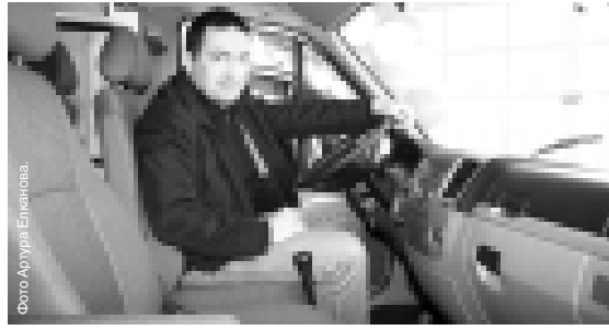
Корреспонденту «КБП» новая «ГАЗель» явно понравилась.

«ГАЗель» была и остается лучшей в своем сегменте по критерию цены. Проведенная модернизация значительно улучшила потребительские качества, теперь будущим владельцам предстоит проверить, стоят ли улучшения тех денег, которые за них просят. Обновленная машина будет выпускаться еще пять лет, за это время производитель обещает подготовить к выпуску совершенно новый автомобиль.