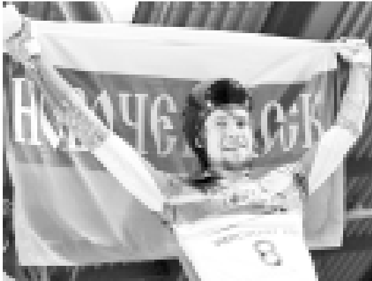
Скелетонист Александр Третьяков, бронзовый призер Олимпиады в Ванкувере.