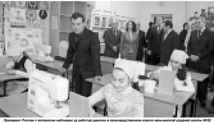
Президент России с интересом наблюдал за работой девочек в производственном классе nail-школы средней школы №32