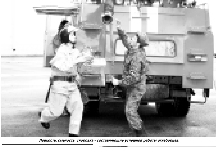
Ловкость, смелость, спорность - составляющие успешной работы огнеборцев.