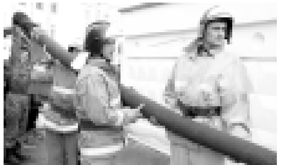
Спасти из огня и от огненной беды.