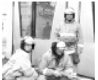
В пожарной службе – настоящие мужчины.