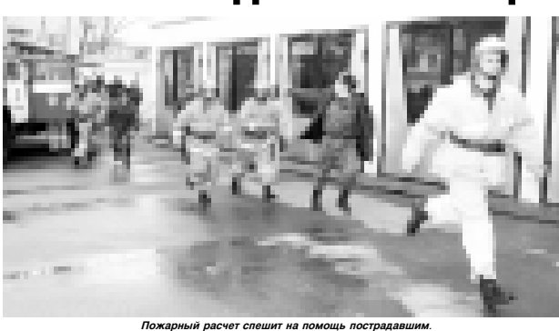
Пожарный расчет спешит на помощь пострадавшим.

(Продолжение. Начало на 1-й с.) Самая горячая пора для пожарных - лето и зима, по статистике, именно в эти сезоны возрастает беспечность людей. Большинство пожаров случается в жилом секторе. В канун новогодних торжеств, памятуя о трагедии в пермской «Хромой лошади», в усеветельных местах жилищных организаций, предприятий и корпоративов проводится тотальной проверке состояния противопожарных водосточников в зданиях, проводимой занятиями с обслуживающим персоналом.