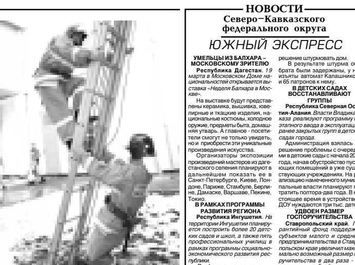
Настоящие огнеборцы не боятся ни высоты, ни огня.