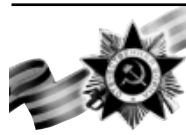
(Окончание. Начало на 1-й с.)