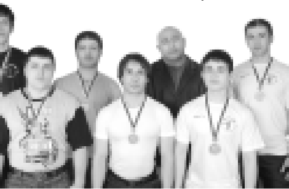
Материалы рубрики подготовил спортивный обозреватель Альберт ДЫШЕКОВ.