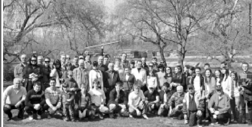
Члены Молодежного правительства и сотрудники Дома Правительства довольны результатами проделанной работы.