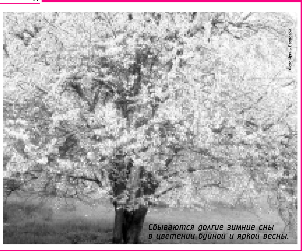
Сбываются долгие зимние сны в цветении буйной и яркой весны.

РЫБЫ (20 февраля - 20 марта) Вероятны напряженные деловые ситуации. Занятый реализацией совместных проектов придется потратить немало времени, чтобы найти общий язык с единомышленниками. Компромисс возможен, не теряйте надежды на успех. Важно проявить терпение, даже если ради этого придется приспособиться к сложным обстоятельствам.