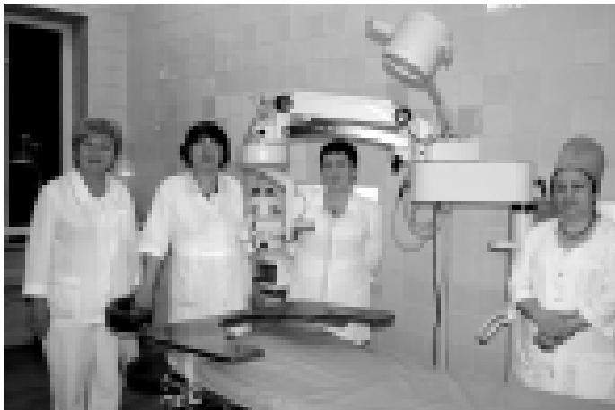
Коллектив офтальмологического отделения - у нового операционного микроскопа.

затем доцентом кафедры глазных болезней и главным врачом консультативной поликлиники г. Орджоникидзе. В 1970 году был приглашен Правительством Кабардино-Балкарии на должность главного врача и заведующего глазным отделением Урванской районной больницы, а в 1976-м переведен в Чегем, где по согласованию с министром здравоохранения СССР Е. Чазовым решено было построить офтальмологический центр.