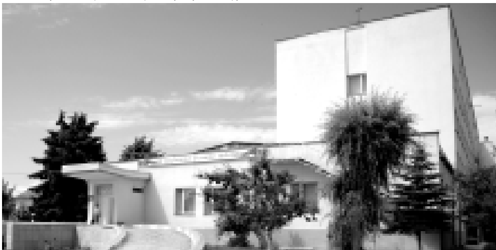
Отремонтированные корпуса и благоустроенная территория улучшают настроение и медикам, и пациентам.

Поддержка руководства и благотворительная помощь земляков создают необходимые условия для успешной работы медиков, а публичное признание заслуг уважаемого человека духовно возвышает всех его коллег.