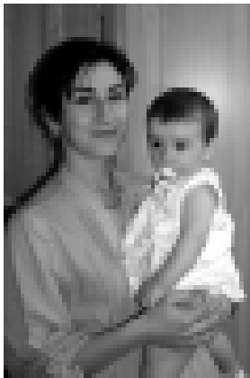
Маленькие пациенты получают лечение в комфортных условиях в отделении, отремонтированном на средства Президента КБР Арсена Каноква.

Значительно улучшены условия работы медиков и пребывания пациентов благодаря проведению капитального ремонта, средства на который выделены большей частью из личного фонда Президента КБР Арсена Каноква. К Дню медработника приуроче-