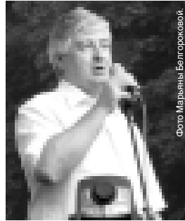
Заместитель полномочного представителя Президента РФ в СКФО Юрий Олейников на форуме.

Писатель также поделился впечатлениями от посещения лагеря: «То, что сделали организаторы, - это колоссально. Еще лет пять-шесть назад нельзя было себе представить,