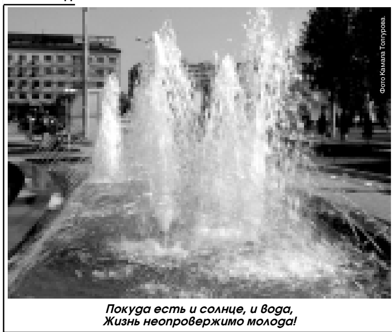
Покуда есть и солнце, и вода, Жизнь неопровержимо молода!