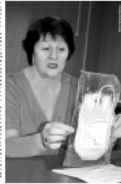
Члены молодежных общественных организаций проводят лекции в вузах, сузах, школах, объясняют, что донорство - безопасная возможность спасти человеку жизнь. При ранениях, ожогах для лечения требуется множество препаратов, но жизнь спасают именно кровь. Дети с онкологическими заболеваниями для поддержания жизни кровь нужна постоянно. В Северо-Кавказском федеральном округе планируется впервые провести 16 сентября акцию «Кавказский донор». В будущем молодые люди надеются каждый год в третий четверг сентября организовывать массовые посещения станций переливания крови по всему округу.

Для надежной защиты реципиентов (тех, кому переливается кровь или ее составные части) на Станции переливания крови установлено самое современное лабораторное оборудование, так что донорство - еще и возможность бесплатно пройти обследование на многие инфекционные заболевания. После сдачи крови надо посетить лабораторию еще раз через полгода, чтобы повторить анализы и убедиться в отсутствии инфекций - некоторые из них имеют длительный инкубационный период, а повторное обследование донора гарантирует безопасность взятной полгода тому назад крови.