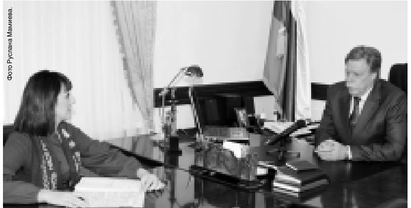
Фото Руслана Мамиева

Пресс-служба Президента и Правительства КБР