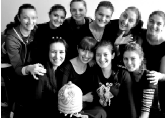
Минуты отдыха после репетиции. Фото на память.

Этот вопрос с Федеральным законом «Об энергообеспечении и повышении энергетической эффективности...» собственники помещений в многоквартирных домах до 1 января 2012 г. обязаны оснастить здания общедомовыми приборами учета потребления воды, электрической и тепловой энергии, а также индивидуальными приборами учета потребления воды, электрической энергии и природного газа. Таким образом, ресурсоснабжающая организация не вправе воспрепятствовать оснащению жилых и нежилых зданий, помещений приборами учета.