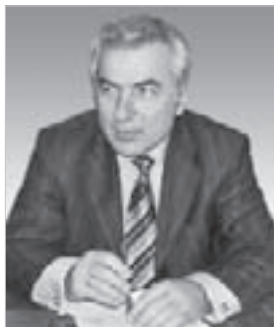
Сафарби ШХАГАПСОЕВ, министр образования и науки КБР