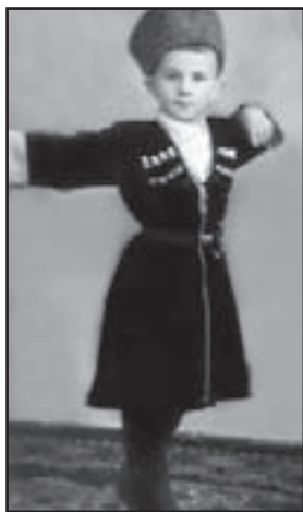
Рахайланы Якубну жашы Хызырни гитче заманчыгы

генди. Битеу саны-чархы, жюриюшо да, ким да сукъланып, къарап турурча, ариу болгъанды аны.