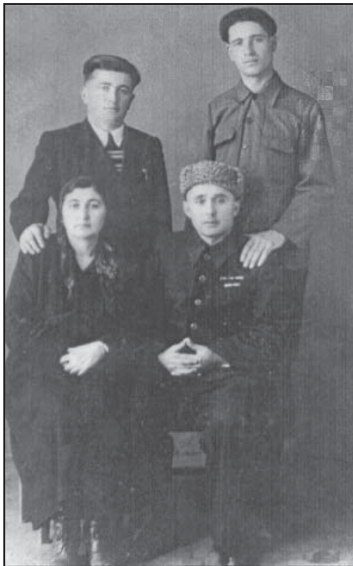
Къулийланы Хажимуса ахлулары бла

сиз, къарыусуз, жалгъан тизгинлери да бардыла. Ала бары да, мен оюм этгенге кёре, энди басмаланырыкъ китапладан кетерилирге, къысталыргъа керекдиле.