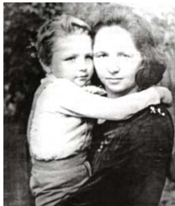
Байдымат жашчыгъы Ахмат бла

Юйретиу иште бек алгъа тамамланырыкъ борч сабийлени гитче заманларындан башлап иш кёллю этиудю. Байдымат назмусунда кызчык уллу болгъан заманда эгер ишлери бла ойнай-ойнай шагъырейленеди. Ол этген жумушла, заманы жетсе, оюндан чыгып аны жашауна кирликдиле. Ма ананы умутун ачыкылагъан, боллукъну болгъанча кёргозтген, къагъанакъ кызчыгына этген булжутуу жыры: