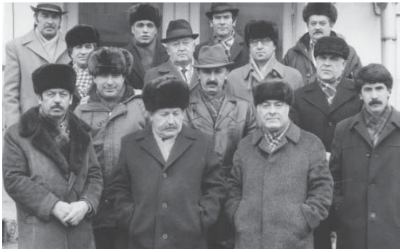
Къабарты-малкъар жазыучуланы къаууму