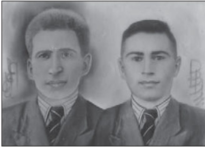
Татчаланы Аслангерий жашы Владимир бла