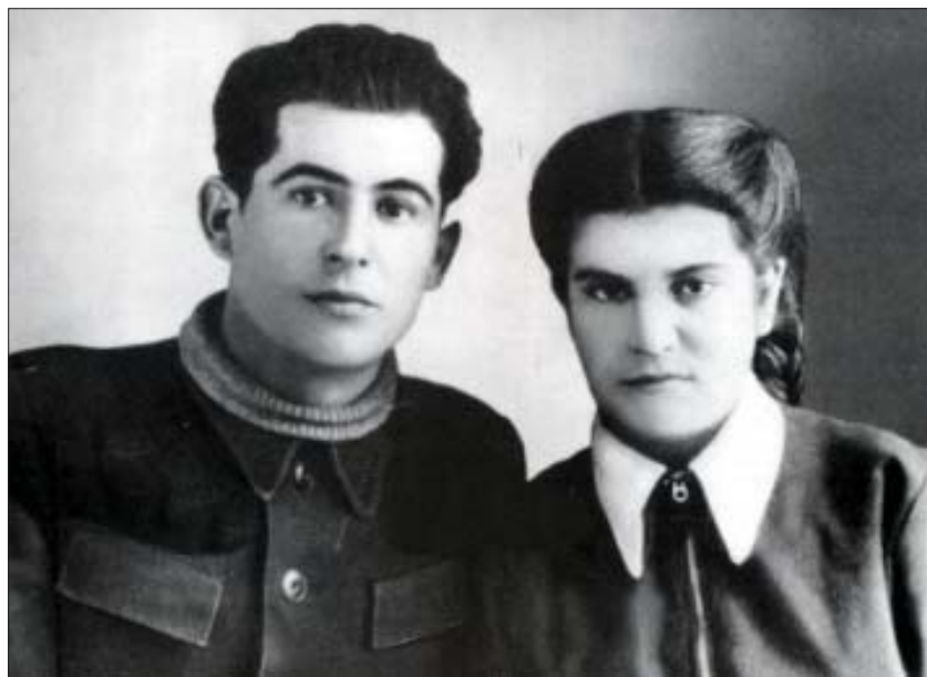
Махуэ Іәлисэхь, ШоджэнцІыкІу Чыгаун. 1949 гъэ