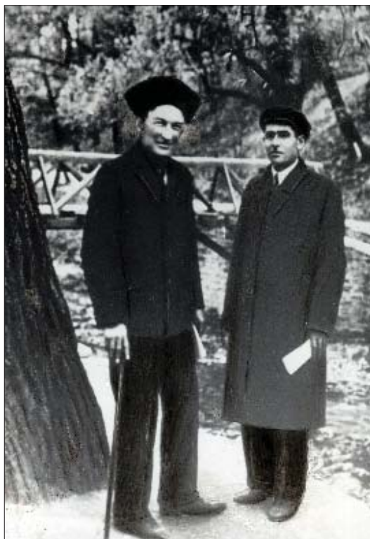
Композитор А. Авраамовымрэ ЩоджэнцЫкІу Алийрэ