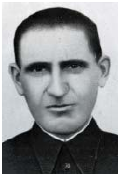
Зул (Алий и кьүэшц)