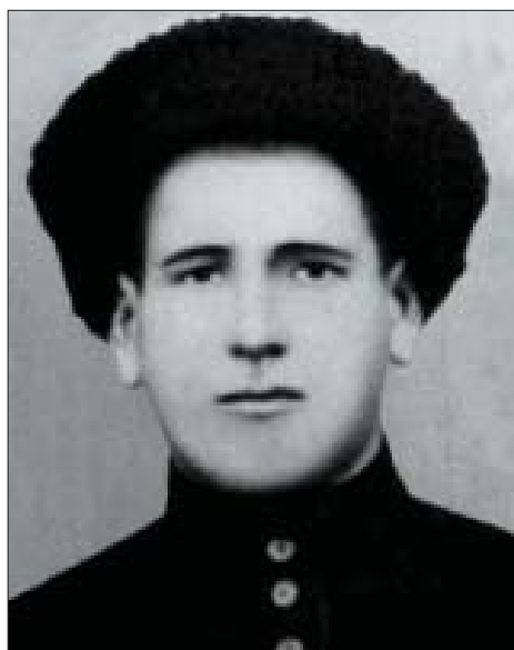
Данил (Алий и кьүэшц)