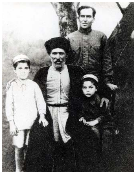
ЩоджэнцЫкІу Алийрэ Емкѳуж Црурэ (Абзуанхѳэблэ шыщц). Сабийхэр: Алий ипхѳу Налжан, Алий и кѳуэ Лиуан. 1936 гѳэ