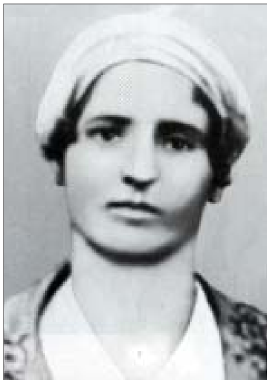
Лиц (Алий и шыпхъуц)