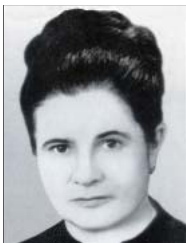
Алий ипхъу Налжан