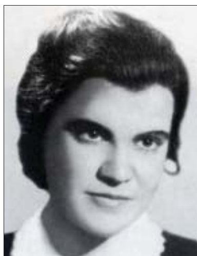
Алий ипхъу Чытаун