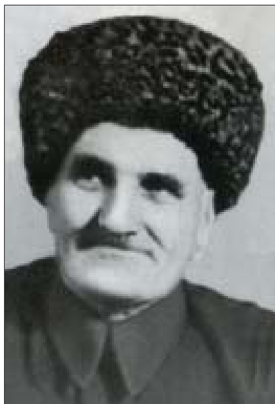
Уэлий (Алий и кьүэшц)