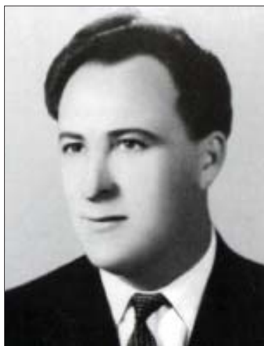
Алий и кьуэ Лиуан