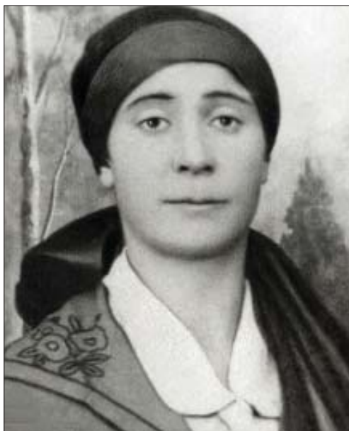
Алий и щхэгъусэ ШэИдэт