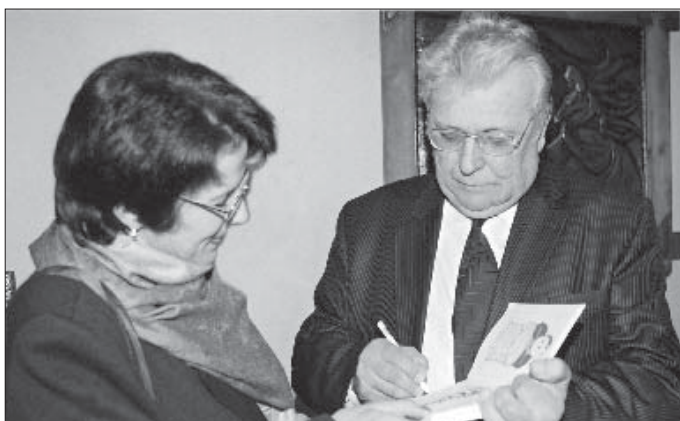
Борис и Іэ телъу абы и тхьлъ и Іэну хэти хуейт