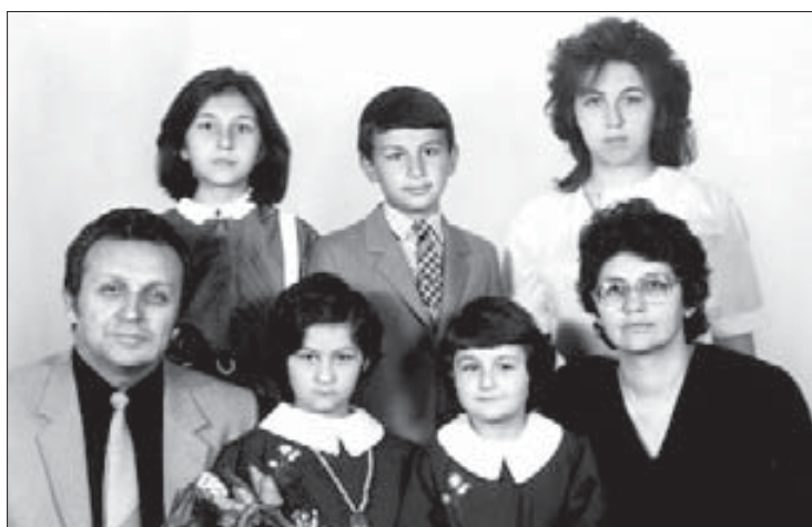
И щхьэггусэмрэ и бынхэмрэ и ггусэу