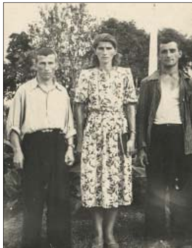
Куэшмэн Серафимэ зяку дэ- тыр иригъэджэу шыта Елгъэр Хъэжидэрэ Кашифрэщ 1954 гъэ

Ар къызыухалъхуар сабийр фыуэ лъагъуныр, абы псэкли гукли хуэ-сакъыныр, телэжьэнрати, а хъэлым сыт щыгъуи теташ. Еш, щхъэх жыхуэплэр ищлэртэкъым абы. Си лэжьэгъуэ зэманыр къэсакъым е иухаш жимылэу, еджаклуэхэми егъэджаклуэхэми япэ школым къэсырт, сабийми балигъми школ пщлантлэр къабгынэжа нэужът езыр щыклуэжыр. Ар