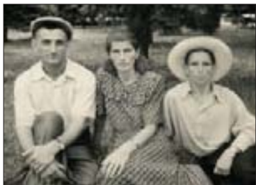
Серафимэрэ абы и дэлъху Ержыбрэ еджакIуэ сыщрагъэжъа махуэрщ. 1955 гъэ, августым и 5. Налшык.