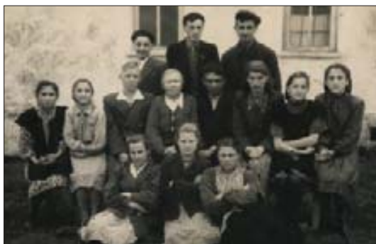
Серафимэ и лэжьэгьухэмрэ иригьаджэхэмрэ я гьусэщ. 1952 гьэ