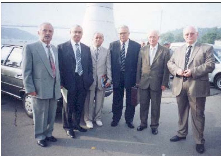
Дунейпсо Адыгэ Хасэм и зи чэзу зэхыхьэр ирагъэкIуэжIыну Истамбыл кIуахэу