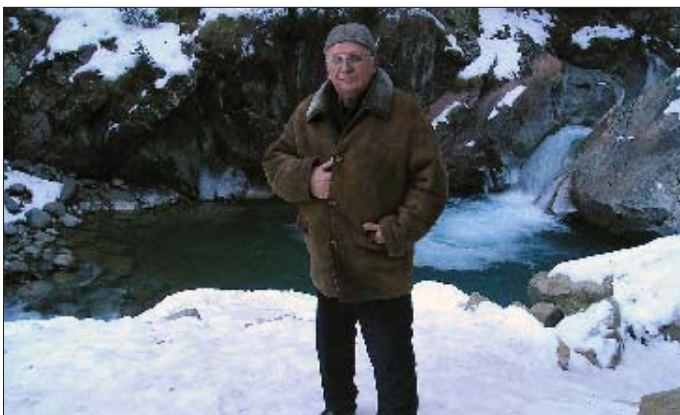
Борис зыцимыгъэщІу хуэнэхъуеиншэт и тхыгъэхэм щигъэлъапІэ и Хэжум и дэтхэнэ теплгъэуэми