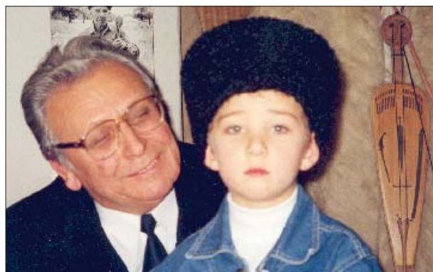
Тыркум кыиЭпхьукыжа Тутыжхэ кьахэхьуа щлалэ цыкIум цIэ фIэзыщар Борист. Иджы Пщымахуэ щлалэшхуэ хьуащ