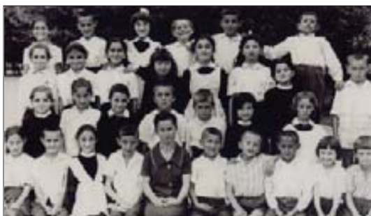
Фази иригъаджэ цыклухэм яхэсу. 1962 гъэ

– Ухъыджэбзыфлщ, Лианэ, уогугъу! Фыкъеплъыт елаллэу дэтхэнэ хъэрфри зэритхым. Псом хуэмыдэу дахэщ хъэрф «Н»-р. Ар ещхъкыым «И»-м е «М»-м. Сэри сфлэфлщ стхыну хъэрф зэкъуэш зэгъунэгъу «Л»-р,-