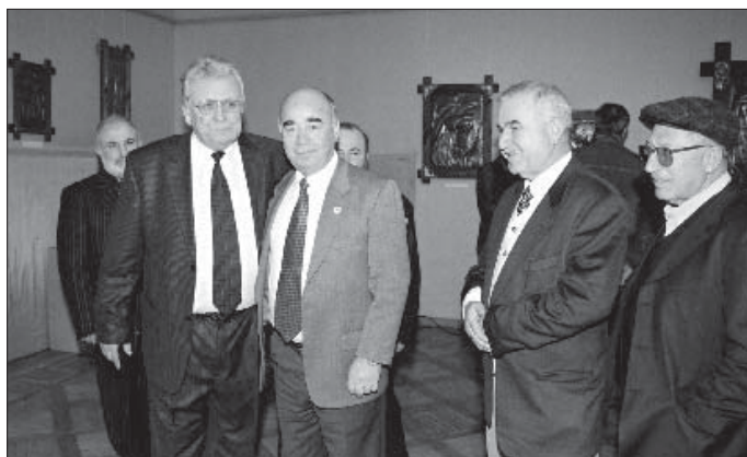
Абы кьрихьэлІащ хамэ кьэрал щыпсэу ди лъэпкъэгъухэм ящыщ гуи