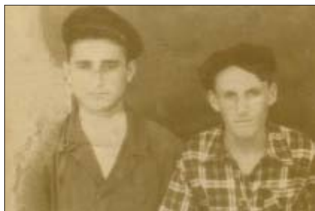
Си къуэш Мухьэб сригъусэу

Апхуэдэ нэмысыншагъэ зэрыслэжъам кърыкIуахэр «ШейтIан къафэ» зыфIэсща повестым, гушыIэ лъэпкъ хэмылгу, къыщысIуэтэжащ. Зи гугъу сщIынурадэкIэ сызыIуаа дыхьэгъхэращ.