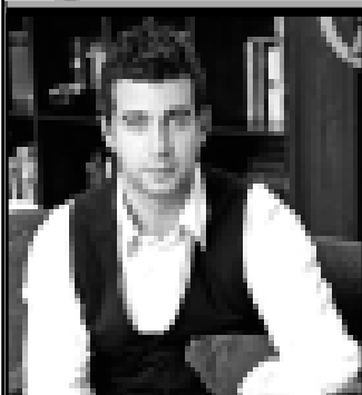
Иван Ургант Для Жаннины; для Юлии

Иван Ургант, знаменитый российский телеведущий и шоумен, родился 16.04.1978 г. в Ленинграде, в семье, в которой все сплошь актеры. Бабушка Ивана – звезда советского фильма «Белорусский вокзал» Нина Ургант, очень близкий Ивану человек: «Музыкальным сопровождением моего детства была песня Булата Окуджавы из «Белорусского вокзала». Помните? «Здесь птицы не поют, деревья не растут...» Нина спела ее в фильме. Я пел ее много лет на всех школьных праздниках.