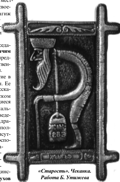
«Старость». Чеканка. Работа Б. Утижева