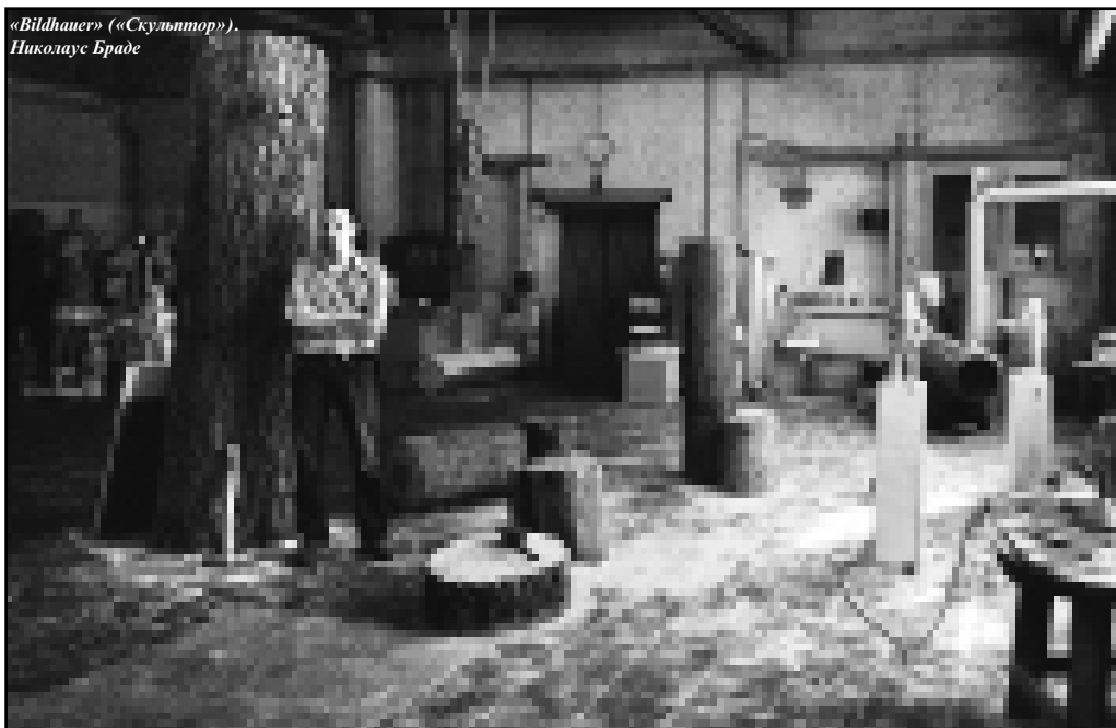
«Bildhaeng» («Скульптор»), Николаус Браде