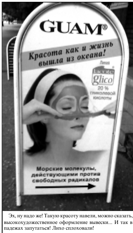
Эх, ну надо же! Такую красоту навели, можно сказать, высокохудожественное оформление вывески... И так в падежах запутаться! Лихо сплеховали!