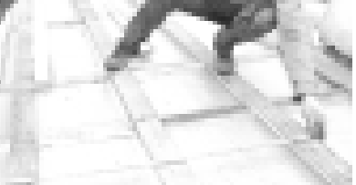
Бугагында республиканы ара шахарында седиреген кеп фатарлы жашуу илеге тийишли ремонт этип, аланы тийишли даражакка келтируу аман кыралганыды.