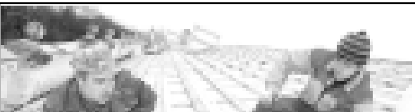
Бусгагында республиканы ара шахарында седиреген кеп фатарлы жашуу илеге тийишли ремонт этип, аланы тийишли даражакка келтируу аман кыралганыды.