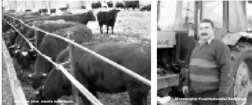
Ийнеке тош азык ашайдыла.

дан узак болмай мал ашланы хар торлосон да ууак эткенерин көрдөк. Жаппу улуу тебирен турган жолундан тыйып, жылы бу кезиунде ишери кылай барганын сорганыбызда, ол былай леде: