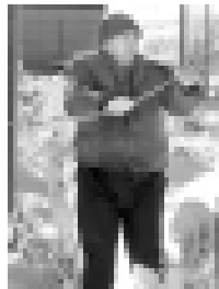
Электромонтерла чыбыкъланы тартадыла.

тынде урунганла арт кюндеде эртенликден кече сагъат онкелеге, биттиге дерди къорешгенлик тохтатмагандыла. Бек алгъа ала социальный макемеледе электрочон эм жылыу болууна этгенди. Рай-