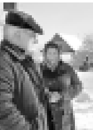
Биттирланы Мухажир эллиле бла.

Республиканы бир къылуи шахарларында бла эллилерде да хал осал эди. Мирныйде эм Шалушкъада электрочыбыкъ козлоген хазна орам жокъду. Мында жашагандыла жети - сегиз кюнню ичинде чы-