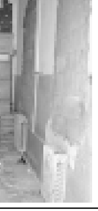
ОСМАНЛАНЫ Айтшат. Сура ты автор алганды.