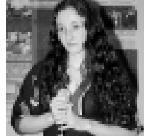
Даурбекланы Лода жырылды.

Биттирланы Азрет да, орус, малкыра тилде кеп кесер жор айтты, бери келгенин тереше этди. Концерт программа бошогандан сора кюнакыла да белшедиле. Ала ветеранды, эр