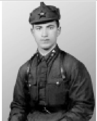
Бу сурат Вольный Ауудла Шагуланни Сраплини ююнде табылганды. Ким болганы да белгисиз. Бу жак, кийимге көрө, баш, уруш алдында жылда кеткенди аскерге. Кээрик биринчи жылдан сора былай берк аскерине киймегендиде.