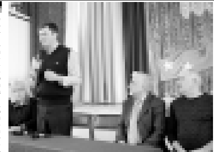
Ратмир Каров келген кыонакыла бля шагырей этиди.

Грузинилени миллет культура араларына прадсдатели Анзор Побжаниде бля тобошуге биринчи прадсдатели атасы Борис Георгиевич бля келгенин билдиргенди. Ол да эбизе ара 1989 жылда кырапгыанын белгилегенди. Ол кезинде бизни республикада 10 миңден артык эбизе жашагачан эсе, бюгонюкюге 2500 адам кыагыландыла.