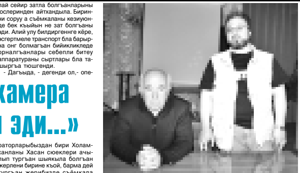
Создан онгнга: фильмин авторлары Айлыяны Къазы-Магомет, Богатырланы Илимасы.

ТЕМИРЛАНЫ Анастоль, СУРАТДА: (создан онгнга) Тенгиз Калдани, Кышкарланы Тимур, Шауаланы Артур, Алексей Сингир-де.