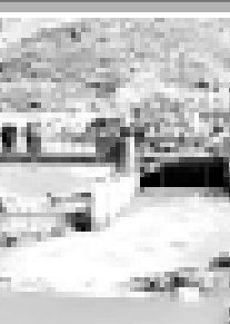
Сварщик Гезуланы Узыр.