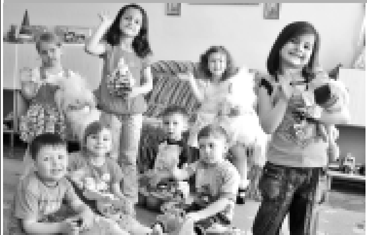
Сабийлени кюнине аталган материалланы 2-чи, 3-чу бетледе окъугъу.