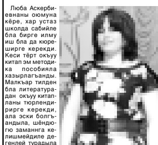
Ахыры 2-чи бетдеди.