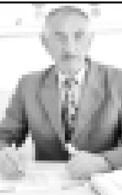
Устав комсомол эм пионер ога ниязланып кеткен кезинде, уллу жарыгы, сөөгө тошкоре.

Устав комсомол эм пионер ога ниязланып кеткен кезинде, уллу жарыгы, сөөгө тошкоре. Музейге жайылган эдиле, башланган аскер казырылык жаны бля окууну-ыркысы мурурда кетерине эдиле.