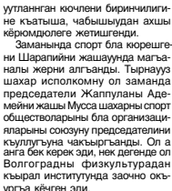
Устав комсомол эм пионер ога ниязланып кеткен кезинде, уллу жарыгы, сөөгө тошкоре.

Башланган аскер казырылык жаны бля сио бизге берген билимизги ючюн бек сау болгунуз, дегге соеоме. Ол жаны бля мен мында барысында да онгумла.