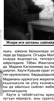
Жури иги залганы сайлайды.