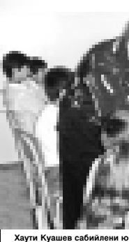
Хутии Куюшев сабилени юйретеди.