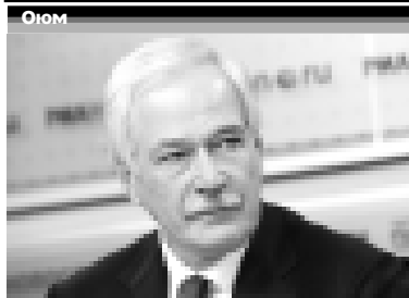
РФ-ни Къырал Думасын Президентени Борис ГРИБЗЛОВ:

ГАЗЕТА ПАРЛАМЕНТА И ПРАВИТЕЛЬСТВА КАБАРДИНО-БАЛКАРСКОЙ РЕСПУБЛИКИ