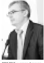
Ахыры 2-чи бетдеди.

Босада жерни кадастр эсеп-ге алынуа дачалы власть органы ишлерине кемил-ликте да бардыла, деп белги-легенди докладчы. Аны сылт-ауларын да тура этгенди. Бирин-чиден, ол ача жетишмегени бла байланышы. «2006-2011 жыллада жеринде тепширил-меген ырысына кадастр эсеп-ге алыну системасын къура-ну» республикалы программа-ны жашауда бардырыргъа