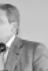
Ахьры 2-чи бетдеди.