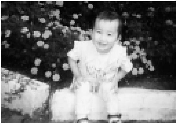
Керимланы (Тамирланга эки жыл болады. Ол Нальчикте жашайды.

Эртреден да Москвада жашап, ишлеп турган гиче этини керке барды. Буслиймат. Элиндеги Нальчикте окуяны бир кере чыкканы тишируу вокзалын уллулугуна, адамланы кеплюкленерге сейр этип кырады. Метрога тоюнгинде уа, абзырыган окуяна эттир.