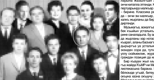
Текуляны Махмуту Ленинградта окугъан кезиуе. 1963 жыл.

Ишин керекте оңуу, туған жерлерин кнчнгоге теримген жашаны бля кыялыны учунуулуларына, билимге, окууга теримгендерини, романтика эгени, жоректерин бийлеп, битеу дуняга эгеме болгандырына дайым да өсиринекем. Оңон жылны ичинде, литература,