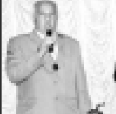
Молпаны Solomen бля Teupаны Nina

ХОПАЛАНЫ Мамзат Суратланы автор алганды.