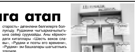
АЛИКАЛЫНЫ В ЛАДИИНА