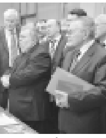
Ингушетияны кырал университети, КъМР-ну агимлери кыруадырхан затлагы да сейир этип кыларчады. Биринчи Север-Кавказ инновация форум кесини ишин 22-чи декабрде дери бардырылдыкыды.