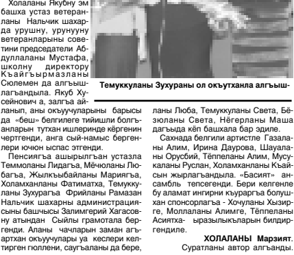
Теммукуланы Зухраны ол окуучулара алгыыш.