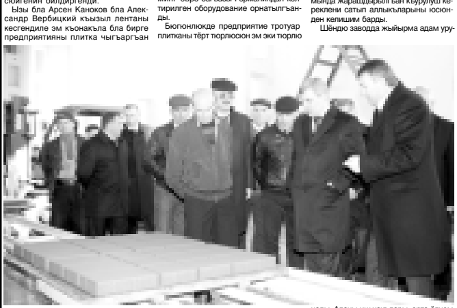
Аланы иш хакълары, орта ёгюм бла алып айтханды, оңтёрт миңгеге жетердик. ОСМАНЛАНЫ Ашаат.

Мында алты жүз бла сексен миңг евро багъасы Германиядан келтирген оборудование орнатылганды. Биюгюнүкде предпритие тротуар плитканы тёрт торлюсю эм тюрт торлюштия эм Чечен республикала бла мында жарашдырылган кыруулуу кереклени сатып алышларыны юсюнден келишим барды. Шенджи заводда жыйрма адам уру