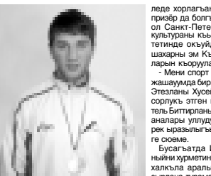
нанда уа, Россейден жаш телюно арасында дунини чемпионуна хорлапты, экинчи жери алгандыгы турнир башында кыралдан келип, аны бля эришилген бш адамны хорлап, биринчи болганды. Ызы бля Швецияда бардырганган эришиулеле он кермежеде кытылган, фин...

Алай бийик даражалы эришиулеле Элюрус юриюу олимпиадада резерви специялизацияланган сайып жаш телю спорт кыоючу оюнулары кеслерин керюорте келгенди. Бу сагында да ала кыралыбызны торпюторлю бийик окуюу юойнеринде билим алдыны эи урулды орунган шахарлы. КМР-ини да атпарандан эришиледи.