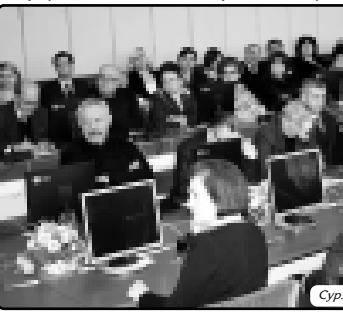
Суртэк КЪАРЕЙ Элнэ триащ