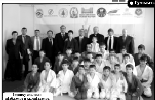
Идигу хъуагъэ и шIбIэбIэрэ и хъуагъэ...