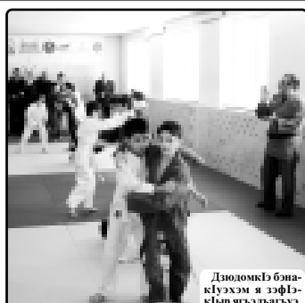
ДюомкIэ банакIуэкIэ и зэфIагъыгъэ...