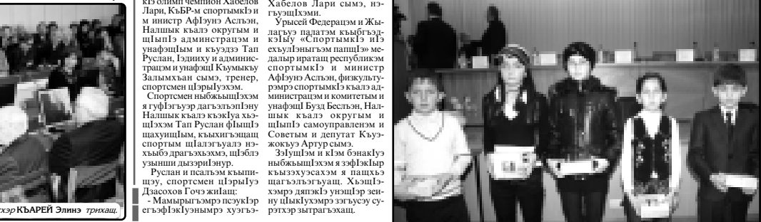
Хъуагъэ гуытIэ зыгуагъэ икIэ псалъэ...