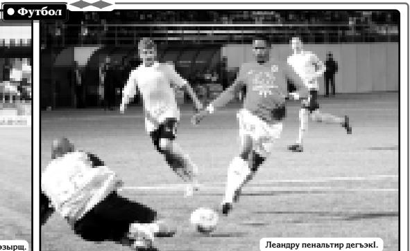
Леандру пенальтир дегэкл.

«Спартак-Налишкым» (Налишк) - «Крылья Советов» (Самар) - 1:0 (0:0). Гытэхэлэм и 12-м Гытэхэлэм и «Шыр жезык» стадион. Шыку 5 000 елпаш.