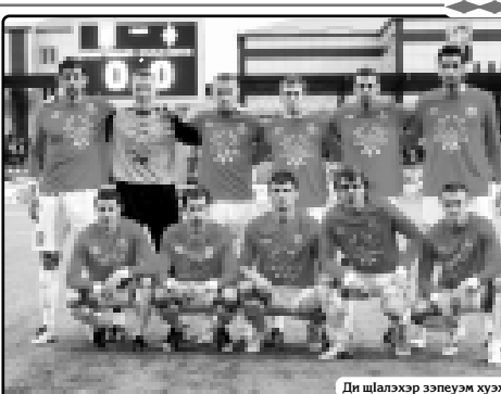
Ди шлалэхэр зэпэуэм хуэхэзыршэ.