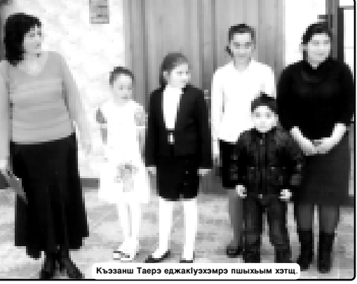
Къэзаш Тарэ аджаклүхэмр пшыкым хэтц