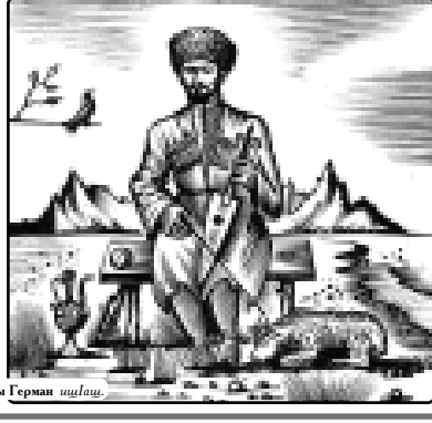
Сурэтэр Пауэты Герман шьыцэ.