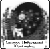
Сурэтэр Поберекжий Юрий шьыцэ.

Гухалэ илэр гухалым хуэфащэщ, Гьащлэуи нэр сыт цыгьуи нэхуэщ. Акьылымшэм и махуэ махуэщэщ, Акьыла зыиэм и лухэр махуэщэщ.