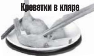
Креветки в кларе

Ингредиенты: 500 г креветок; 2 столовые ложки крупной соли; 2 лавровых листа; соль.