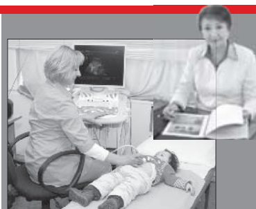
Юбилей стр. 3