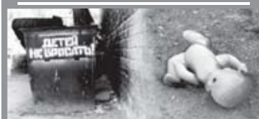
Есть вопрос стр. 5