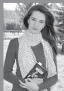
Читатель недели стр. 14

Дорогой читатель! Ты можешь оформить подписку на "Горянку" на II полугодие 2011 года в любом почтовом отделении