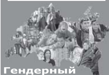
Гендерный сбой стр. 6, 11