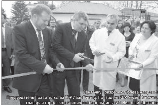
Ленточку разрезают (слева направо) Председатель Правительства КБР Иван Гертер, Президент КБР Арсен Канок, главный врач городской клинической больницы №1 Николай Шогенов

Здание роддома было введено в эксплуатацию в 1968 году, но капитального ремонта оно дождалось только сейчас. На эти цели из городского бюджета было направлено около 28 млн. рублей. Прием пациентов был прекращен с августа прошлого года, и сразу же начались ремонтные работы. В достаточно короткие сроки сделано очень много. Строители демонтировали все коммуникации, со стен отбивалась старая штукатурка — до кирпича, снимались старые покрытия полов, оконные рамы, двери, включая и подвальное помещение. Ряд помещений был реконструирован, для чего выкладывались новые стены, восстанавливались перегородки между палатами. Теперь на стенах новая штукатурка из современного материала «Волна», все окна и двери — металлопластиковые, по всему зданию проведены электромонтажные работы, произведен ремонт