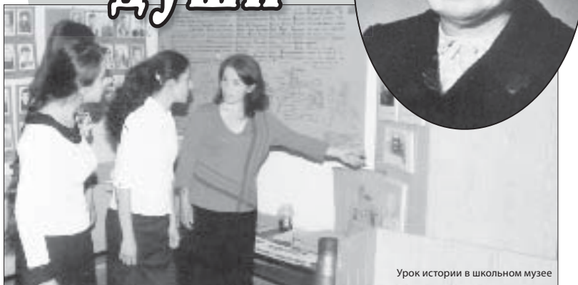
Урок истории в школьном музее