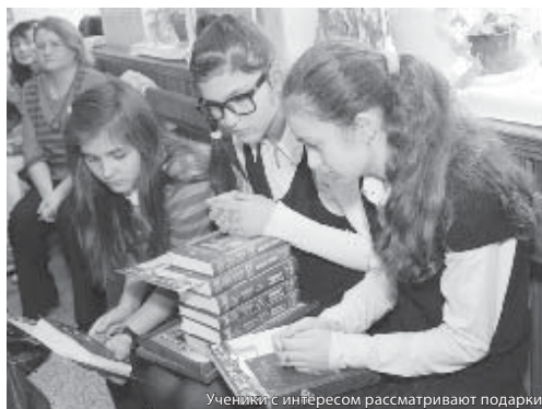
Ученики с интересом рассматривают подарки

Помимо участия в столь значимых мероприятиях, не прекращалась ежедневная, кропотливая и вдохновенная работа в сфере популяризации книги и приобщения к ней новых, в первую очередь, самых юных читателей. Об этом говорилось не только в основном докладе председателя общества книголюбoв (также с благодарностью подчеркнувшей роль республиканских