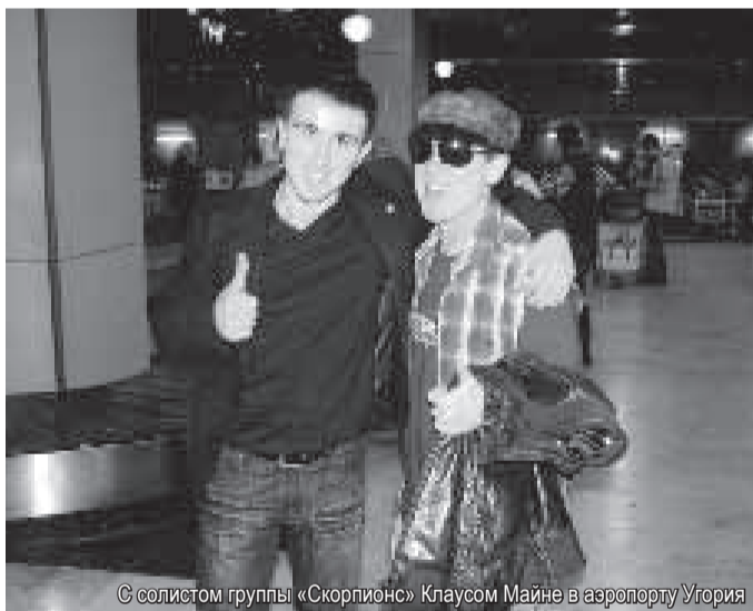
© солистом группы «Скорпион» Клаусом Майне в аэропорту Угория

- Исполняем классические рок-баллады примерно для сотни человек, собравшихся