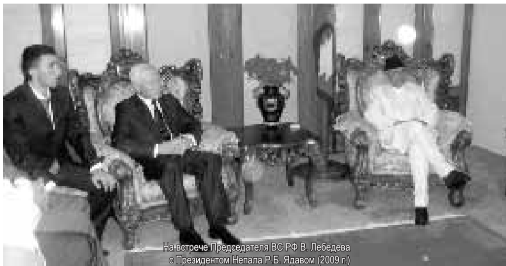
На встрече Председателя ВС РФ В. Лебедева с Президентом Непала Р.Б. Ядавом (2009 г.)

Мы все должны быть очень ответственными перед Россией независимо от