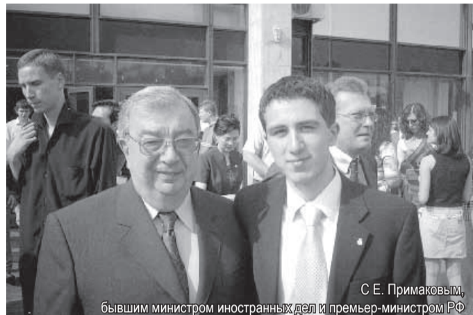
С.Е. Примаковым, бывшим министром иностранных дел и премьер-министром РФ

- Увлечение футболом осталось. Играл в сборной МГИМО, в футбольной команде банка. В 2001 году, еще учась в школе, стал одним из учредителей всероссийского фан-клуба «Реал Мадрид». Нас неоднократно приглашали – и мы ездили в Мадрид поддержать любимую команду с трибун «Сантьяго Бернабеу». Сами принимали