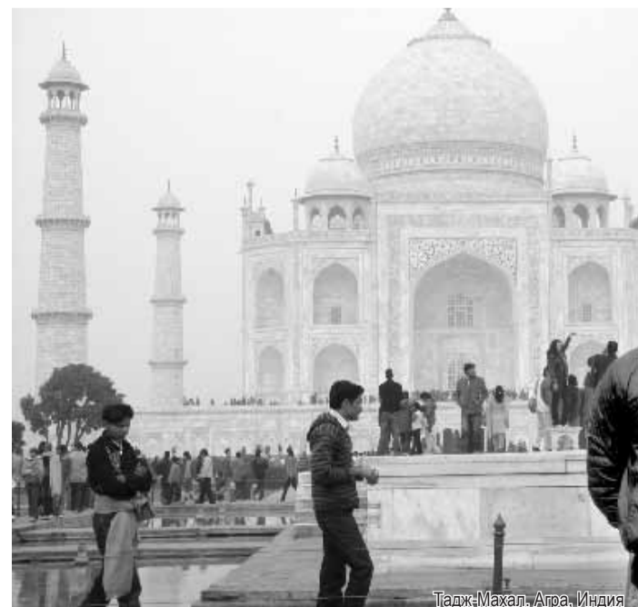
Тадж-Махал. Агра, Индия

Также занимаюсь нотариальными услугами и как руководитель органа ЗАГС имею право заключить или