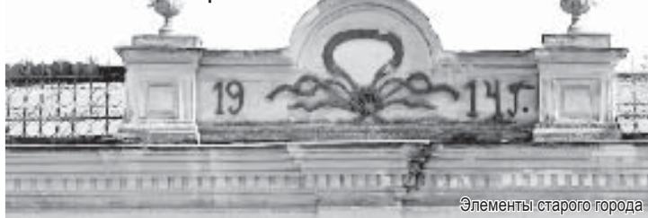
Элементы старого города